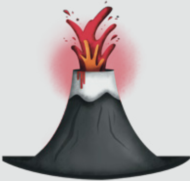
ERUPCIÓN DE UN VOLCÁN

Si vives en departamento, considera también en esta evaluación las condiciones del edificio, como por ejemplo, iluminación de pasillos y escaleras, ductos de ventilación, escaleras de emergencia, ascensores, áreas comunes, entre otras.