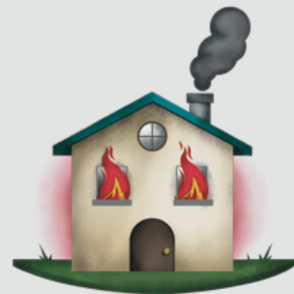
INCENDIO EN CASA