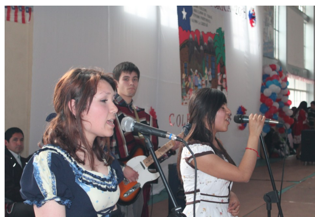
Alumnos de Tercero Medio interpretando "Para Ama" de Los Prisioneros.