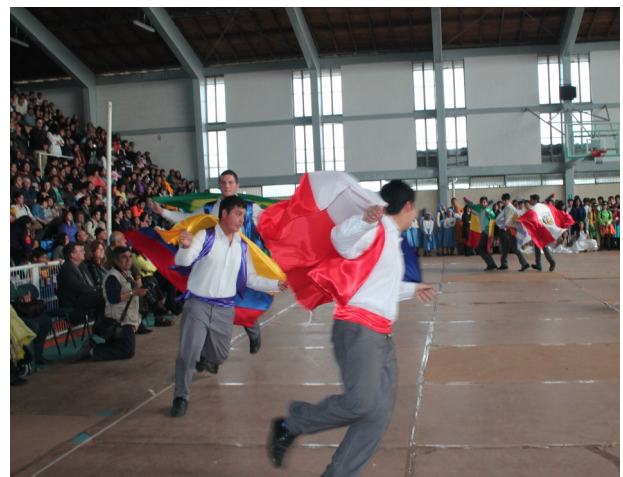
Tercero Medio con "Mambo de Machaguay"