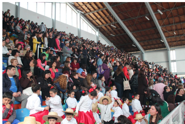
Parte del público asistente.